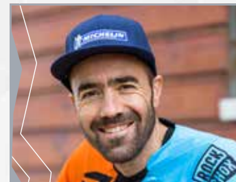
Nicolas Vouilloz Rekord-Weltmeister im Downhill

Nicolas hat immer wieder Grenzen überschritten. Nicht umsonst wird er ET genannt. Rekordweltmeister, dann erfolgreicher Rallye-Fahrer und nun eine beeindruckende Karriere im Enduro-Segment. Das eMountainbike ist für ihn Trainingsgerät und Spaßbringer zugleich.